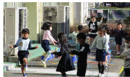
熱心に練習しました

冬休み中、ないことを願いますが事故等生活の大きな変化がありましたら御連絡ください。平日には日直がいます。(土曜日と日曜日、12月29日～1月3日の閉庁日は、日直がいません。1月4日に御連絡ください。) 平日8:30～16:30 豊岡北小学校 62-2036