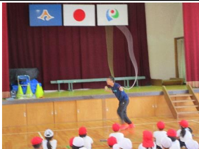
5mの縄で前回し跳び