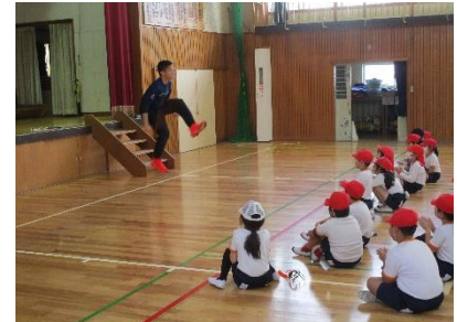
ギネス記録の「5重跳び」を披露