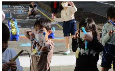
縄で『矢』をつくりました