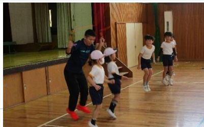
複数人でも楽しめる技とコツを体験