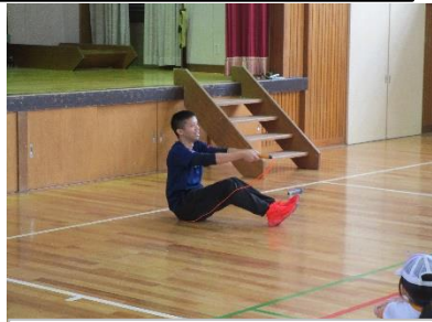
「おしり跳び」を披露