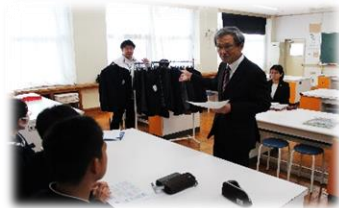
委員長より趣旨説明↑

「意見交換会」において、代表生徒たちは、興味深く熱心に会に臨みました。上下の色の組み合わせ、柄と無地との比較考察などを丁寧に行う姿がありました。