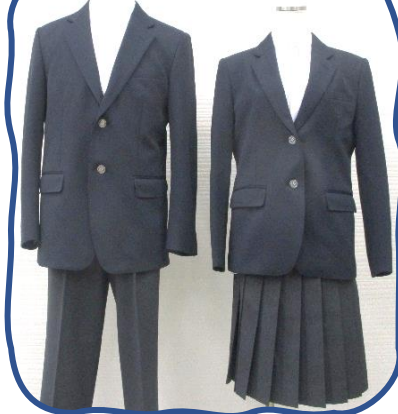
濃紺& チャコールグレー